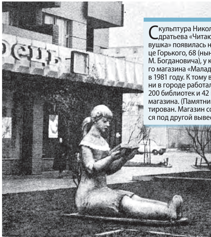
Скульптура Николая Кондратьева «Читающая девушка» появилась на улице Горького, 68 (ныне улица М. Богдановича), у книжного магазина «Малодось» в 1981 году. К тому времени в городе работали более 200 библиотек и 42 книжных магазина. (Памятник демонтирован. Магазин сохранился под другой вывеской).