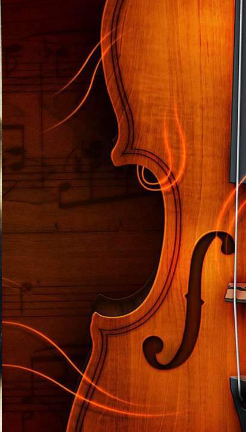
Адам Русак. Ленінградські перьяд.