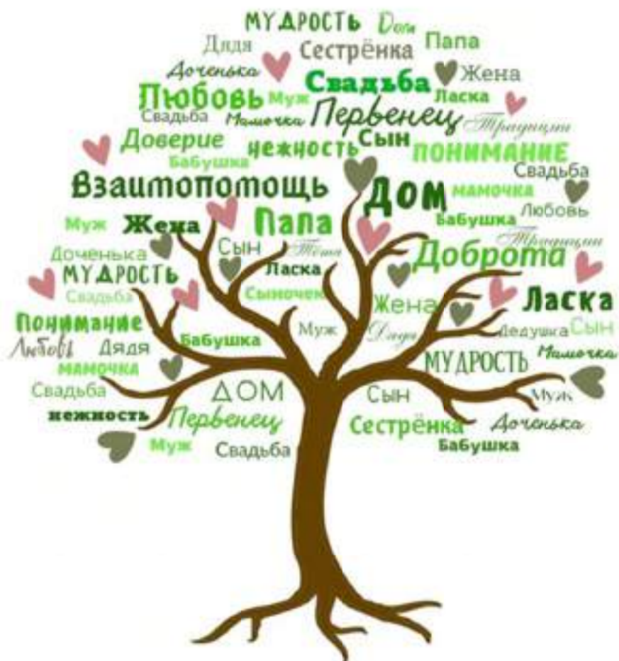
Эмблема семейного любительского объединения «Продвинутые мамочки»

Мероприятия объединения проходят как на базе Вязинского сельского дома культуры, так и вне стен клубного учреждения (например, агроусадебка «Калодачки», кемпинги и т.д.).